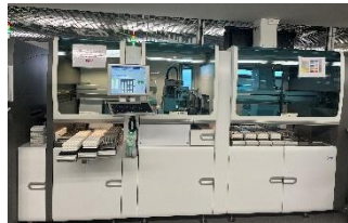
Module P612 Plateau technique Clinique des Cèdres