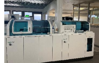
Cobas Pro Module C503 E801 Plateau technique Clinique des Cèdres

Dans le cadre de notre démarche d'amélioration continue de la qualité et du service client, le laboratoire Inovie les Cèdres s'est doté de nouveaux systèmes analytiques en Biochimie / Immunologie. L'investissement dans ces automates plus performants s'inscrit dans notre politique qualité dont les 2 axes fondamentaux sont la fiabilité du résultat et la satisfaction du client.